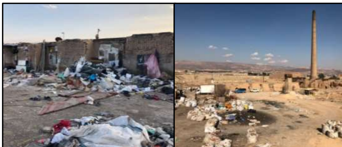
شکل ۲- تصاویری از محل اسکان زباله‌گردها

[اینجا زمین مال کی هست؟] مال به بنده خدایی هست. کوره‌های قدیمیه، زمین رو اجاره می‌کنیم. اینجا برجی سه تومن اجاره می‌دیم و سه تومن [منظور سه میلیون تومان است] هم پول برق می‌دیم. [آب داره؟] نه، آب شیرین نداره؛ آب چاه داره، چون فشار آب کمه، پمپ رو می‌سوزنه. برا آب خوردن هم ماشین می‌آد، دبه‌ای می‌خریم، دبه‌ای ۱۵۰۰ تومن. [اینجا حمام داره؟] نه، باید بری اسلام‌آباد. شش هزار می‌گیرن، پول آب خالی، هفته‌ای یک بار می‌ریم. [چطور محل خوابتون رو گرم می‌کنید؟] خطری شما رو تهدید نمی‌کنه؟ با گاز؛ نه، خطری نداره، سوراخ زیاد داره.